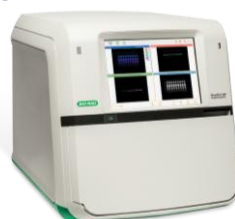
BIO-RAD ChemiDoc MP 螢冷光影像系統