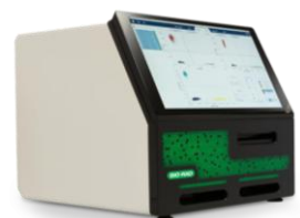
BIO-RAD QX700 ddPCR 7色微滴式數位核酸偵測系統