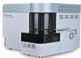
CYTEK Northern Lights 全光譜流式細胞儀